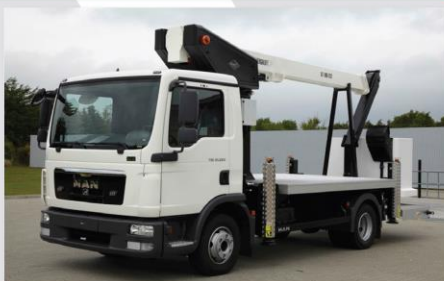
Zábleskové svetlo na stípe