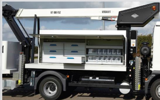
Skrinka na náradie TIME Smartbox (voliteľná výbava)