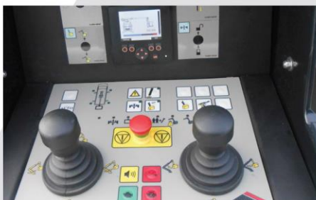
FPC: proporcionálne CANbus ovládanie s displejom