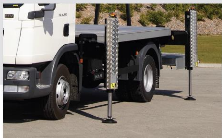
Rozťahovacie podpery typ "H"