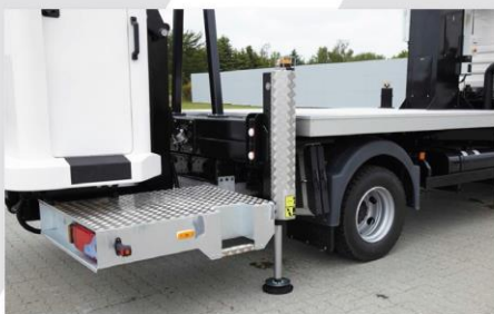
Zadná nástupná plošina (symetricky uložený kôš)