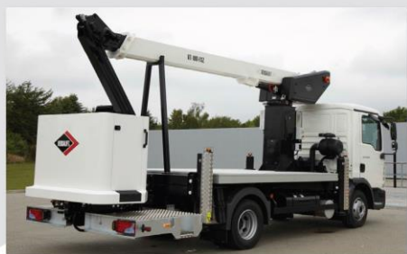
Široký pracovný kôš pre 2 osoby