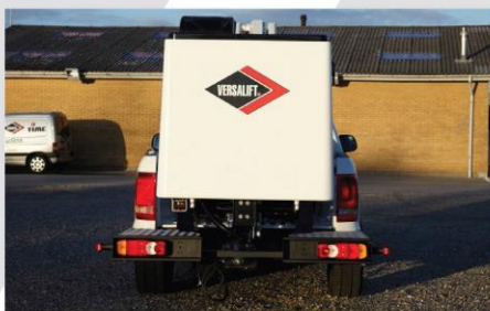
Pracovný kôš pre 2 osoby