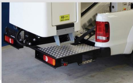
Zadná hliníková nástupná plošina