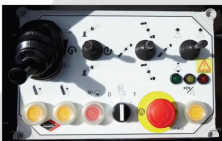
LH proporcionálne ovládanie