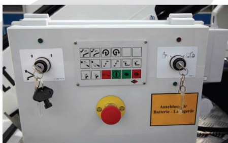
Dolné ovládanie (hlavná skrinka)