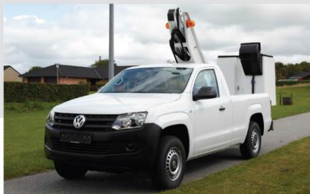
Zábleskové svetlo na stípe (voliteľná výbava)