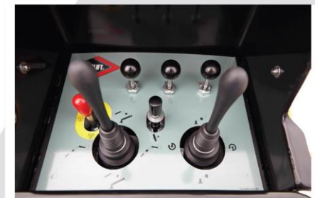
Plnohydraulické horné ovládanie