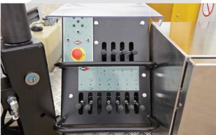
Plnohydraulické dolné ovládanie