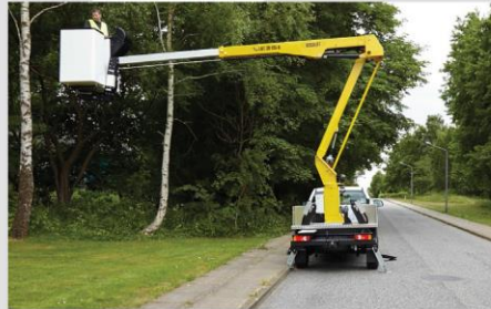
Pri otáčaní nepresahuje obrys spätných zrkadiel