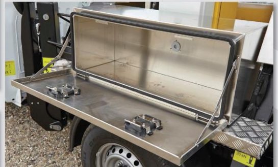
Hliníková skrinka na náradie (voliteľná výbava)