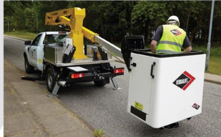
Nástup do koša zo zeme