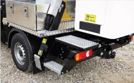
Hliníkový nástupný schodík do koša (voliteľná výbava)