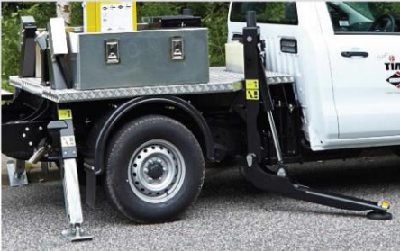
Radiálne podpery (vpredu) + podpery typ "A" vzadu