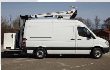
Zábleskové svetlá na stípe