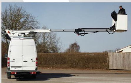
Pri otáčaní nepresahuje obrys spätných zrkadiel