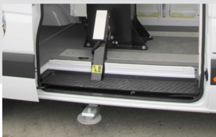
Podpery typ "A"