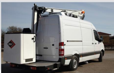
Zadná nástupná plošina (asymetricky uložený kôš)