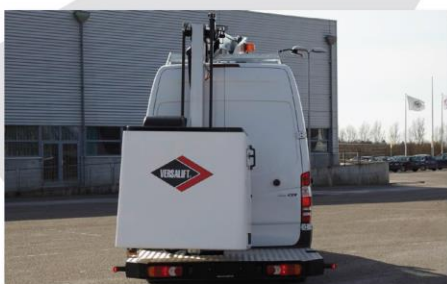
Hliníková nástupná plošina