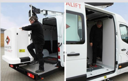
Priamy prístup z kabíny do koša (voliteľná výbava)