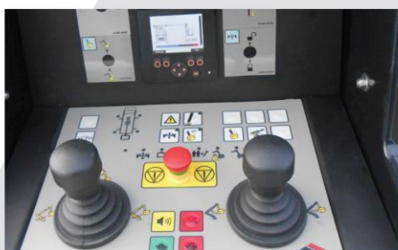
Proporcionálne CANbus ovládanie s displejom