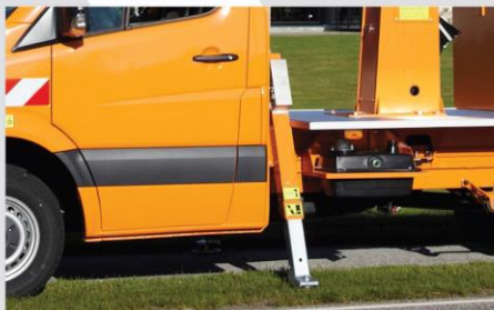
Podpery typ "A"