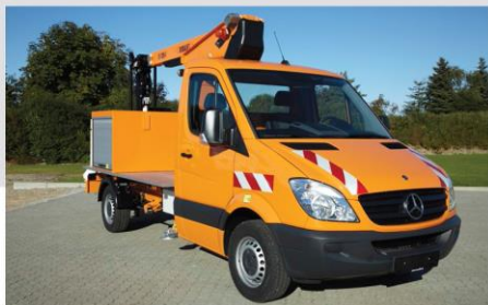
Zábleskové svetlo na stípe