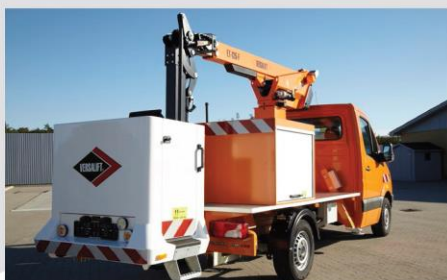
Bez zadnej nástupnej plošiny (voliteľná výbava) **