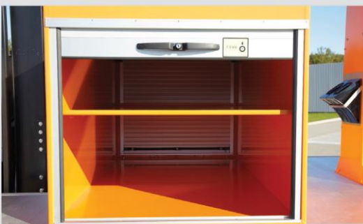
Skrinka na náradie s 2 roletovými dverami (voliteľná výbava)