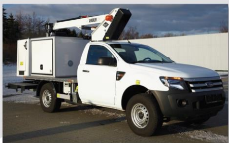
Zábleskové svetlo na stípe