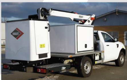
Zadná nástupná plošina (asymetricky uložený kôš)