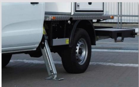
Podpery typ "A"