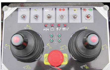
IPC: ovládanie 2 joystickmi