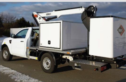
Skrinka na náradie TIME Smartbox (voliteľná výbava)