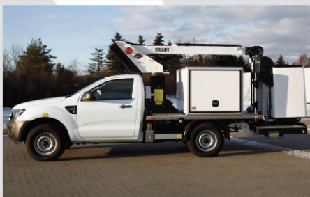
Zadná hliníková nástupná plošina