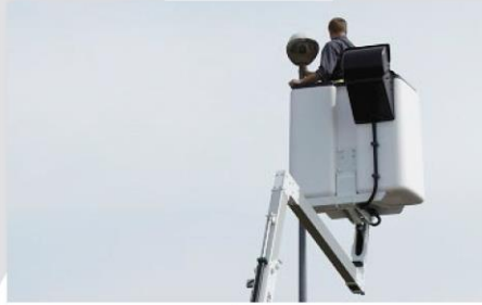
Kôš pre 2 osoby