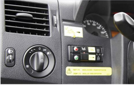
Ovládací panel v kabíne