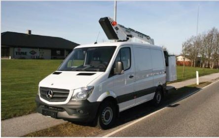
Zábleskové svetlá na stípe