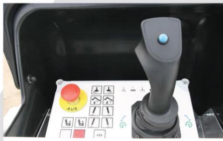
Proporcionálne ovládanie (1 joystick)