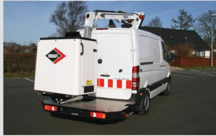
Zadná nástupná plošina (asymetricky uložený kôš)