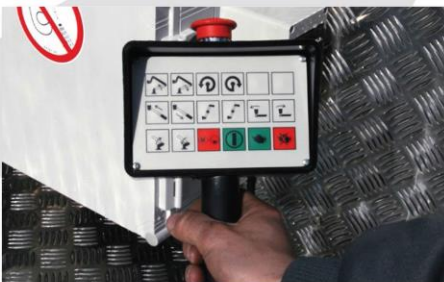
Spodné káblové ovládanie