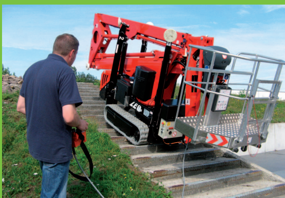
Plošina s pásovým podvozkom – vysoká prejazdnosť v teréne