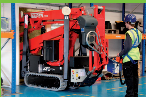
Kompaktné rozmery – možnosť prechodu cez dvere šírky 80 cm