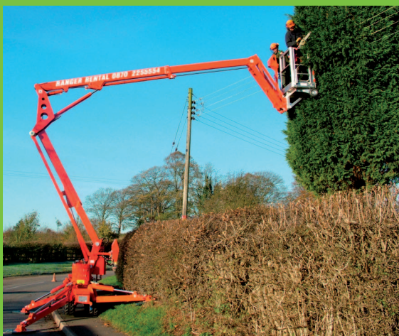
Automatické vyrovnanie plošiny podpernými nohami