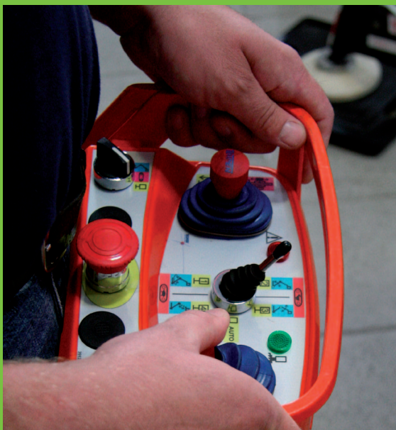
Jednoduché a prehľadné ovládanie